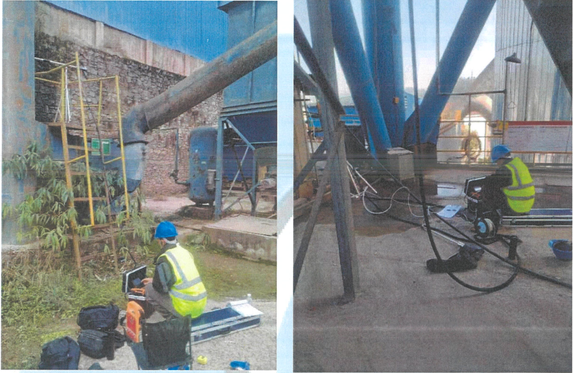
图8-2 部分现场采样照片